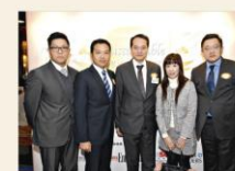
香港賽馬會「賽馬」成立於 1864 年，現已發展成為全球最富活力的體育機構之一，亦是香港最大型的體育公益機構機構，2012/13 年度公益事務報告獲頒十九項公益獎項。