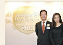
香港賽馬會「賽馬」成立於 1864 年，現已發展成為全球最富活力的體育機構之一，亦是香港最大型的體育公益機構機構，2012/13 年度公益事務報告獲頒十九項公益獎項。